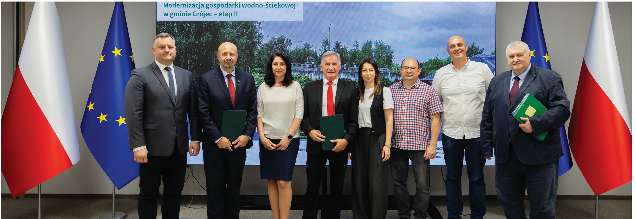
Modernizacja gospodarki wodno-ściekowej w gminie Grójec – etap II

Projekt pod nazwą „Modernizacja gospodarki wodno-ściekowej w gminie Grójec – etap II” to warta dziesiątki milionów złotych odpowiedź na współczesne wyzwania ekologiczne i wymogi unijne. Dzięki oficjalnemu podpisaniu umów w dniu 25 maja 2026 roku w Narodowym Funduszu Ochrony Środowiska i Gospodarki Wodnej (NFOŚiGW) w Warszawie, inwestycja wkracza w fazę realizacji, a większość kluczowych prac zaplanowano na lata 2027–2029.