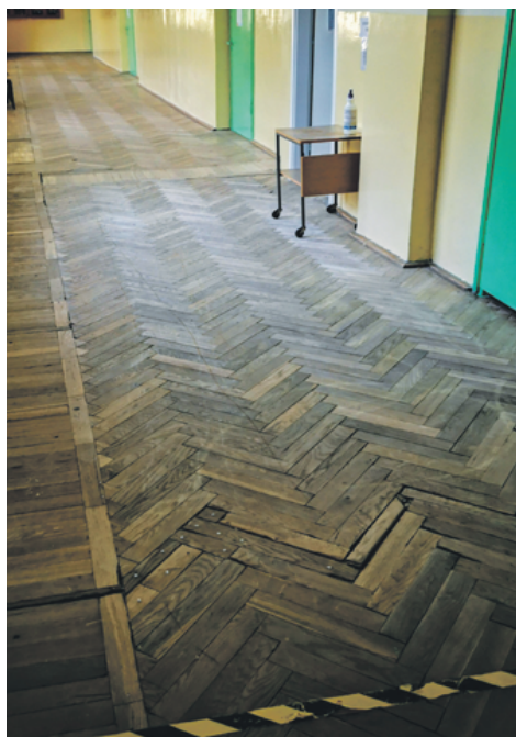
ZS w Grójcu