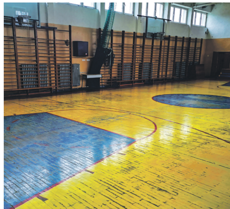
Sala gimnastyczna w ZS w Warce